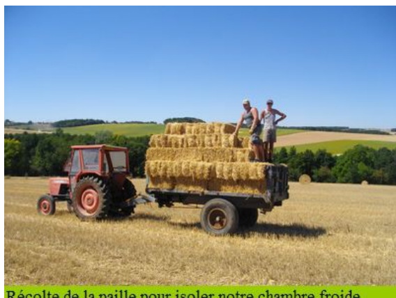
Récolte de la paille pour isoler notre chambre froide