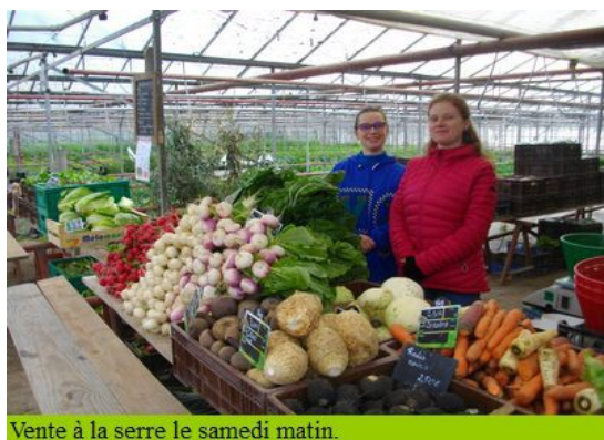
Vente à la serre le samedi matin.

Avec sérénité et maturité, le Jardin du Marais poursuit son chemin grâce à tous ses clients fidèles et affables dans les AMAPP ou à la serre, grâce à Terre de liens qui a consolidé l'assise foncière en 2013, et aussi grâce à la chance et aux rencontres qui font que la Vie reste toujours aussi imprévisible et surprenante.