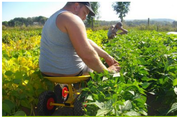
Siège de récolte pour les haricots verts