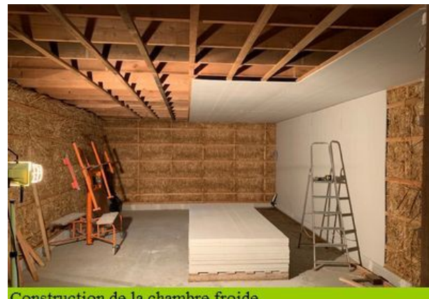
Construction de la chambre froide