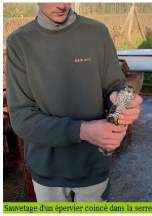
Sauvetage d'un épervier coincé dans la serre