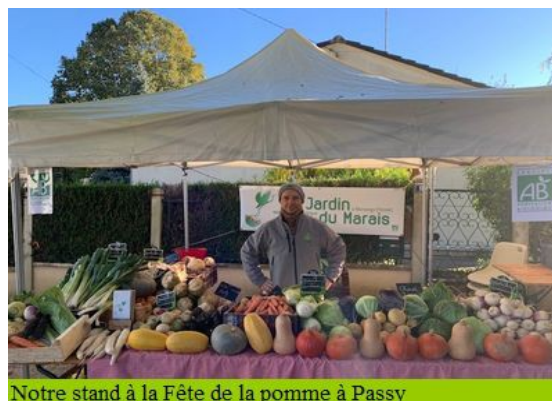
Notre stand à la Fête de la pomme à Passy