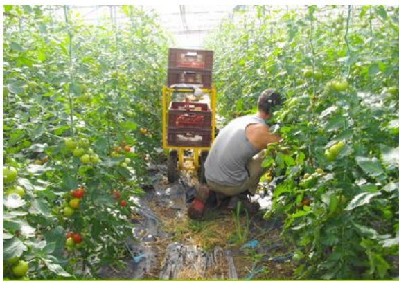
Landau de cueillette pour les tomates