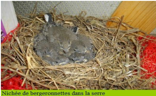
Nichée de bergeronnettes dans la serre

Nous cohabitons avec toute cette biodiversité, tout en maintenant un niveau de production rentable.