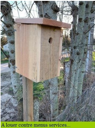
A louer contre menus services...